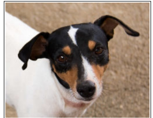
PITUFA D3482 Female Bodeguero Hembra Bodeguero