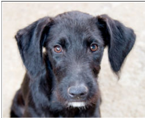
MORGAN D3484A Male Mongrel Macho Mestizo