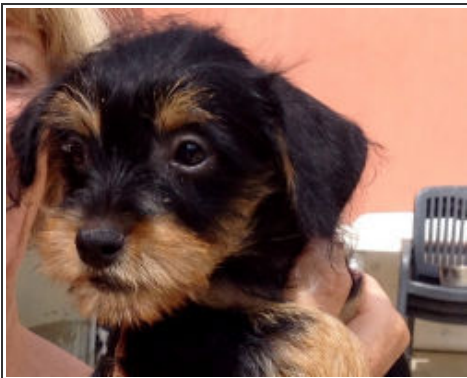
REMUS D3490B Male Dachshund Cross Macho Dachshund Cruce