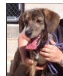
Ellis Female Mongrel Hembra Mestizo