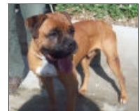
Drake Male Boxer Macho Bóxer Cruce