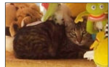
Flora Female Kitten Hembra Gatito