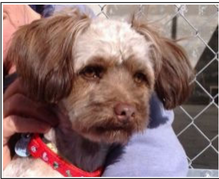
LUNA - D3323 Female Poodle Cross Hembra Caniche Cruce