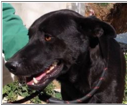
DUKE - D3328 Male Labrador Cross Macho Labrador Cruce