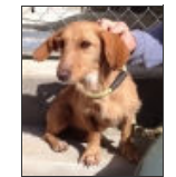
Coco Female Podenco Cross Hembra Podenco Cruce