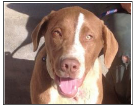
SADIE - D3331 Female Mastin Cross Hembra Mastin Cruce

ADANA - Estepona (Málaga), España, Web: www.adana.es