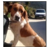
Tiger Male Beagle Cross Macho Beagle Cruce