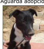
George Male Bodeguero Cross Macho Bodeguero Cruce