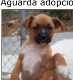
Camuri Female Labrador Cross Hembra Labrador Cruce