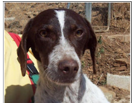
ARMADA - D3032 Male Pointer Cross Macho Pointer Cruce