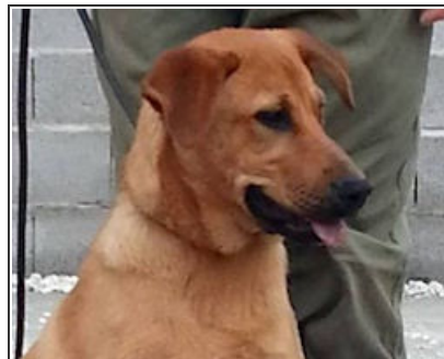
DUDA - D3214 Female Labrador Cross Hembra Labrador Cruce