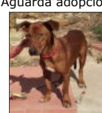
Bruno Male Podenco Macho Podenco