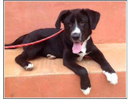
DANA - D3136 Female Labrador Cross Hembra Labrador Cruce

ADANA - Estepona (Málaga), España, Web: www.adana.es