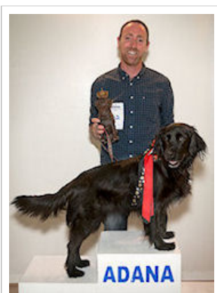
Best in Show - Ruby Mejor de Concurso - Ruby