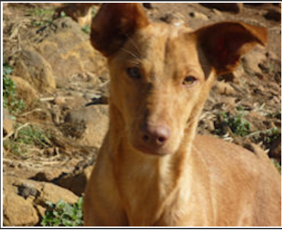
CHINA - D2299 Male Podenco Macho Podenco