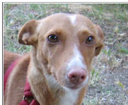
LUNA - NR1307-11 Female Podenco Hembra Podenco