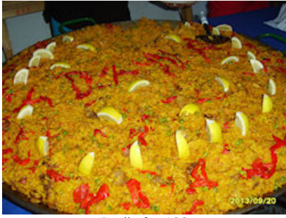
Paella for 100 Paella para 100