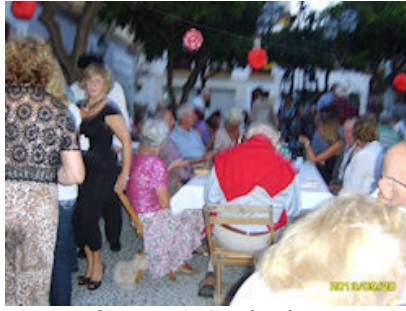
Guests enjoying the show Los huéspedes disfrutar del espectáculo