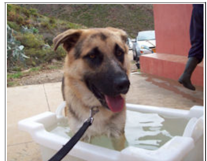
ETAIN - D2746 Male German Shepherd Macho Pastor Aleman