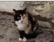
Scruff Female Cat - Gata

Please help us keep the animals safe and healthy by donating today.