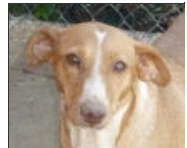
Flower Female Podenco Hembra Podenco