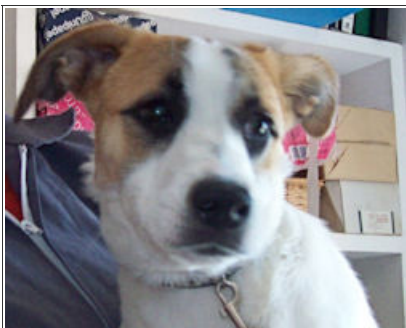
FELISA - D2882 Female Boxer Cross Hembra Bóxer Cruce