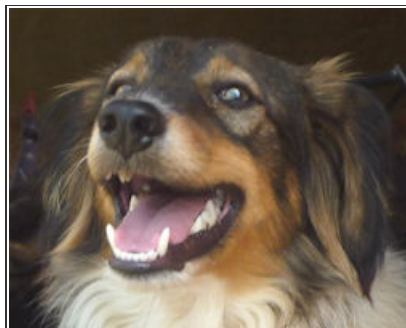
TES - D2219 Male Spaniel Cross Macho Spaniel Cruce