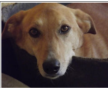
ROBBIE - D1910 Male Podenco Cross Macho Podenco cruce