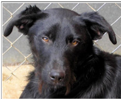
EVA - D2445 Female Labrador Cross Hembra Labrador Cruce