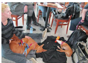
The Podencos at the Málaga airport Los Podencos al aeropuerto de Málaga

On November 21, 2011 six podencos left Málaga for a new life in Holland thanks to PodencoWorld. Nelson, Pandora and Pluto from the ADANA shelter, Camper from a shelter in Los Barrios, Teun from the shelter of Animales y Plantas de Málaga and Fonsi from Granada rescued by six Spanish young people.