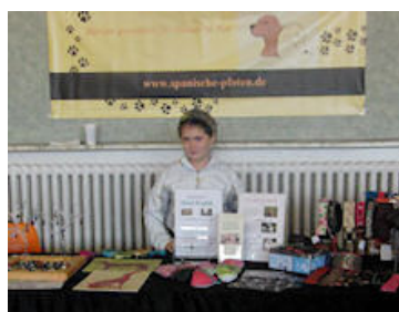
Spanische-Pfoten mini-fair for ADANA Spanische-Pfoten mini-feria para ADANA

Se han establecido contactos similares con una organización alemana, spanische-pfoten (Patatas Españolas). Esta caridad basada en Essen fue creada por un grupo de voluntarios asombrados por el número de perros abandonados en España, quienes recaudan dinero específicamente para los centros de rescate españoles.